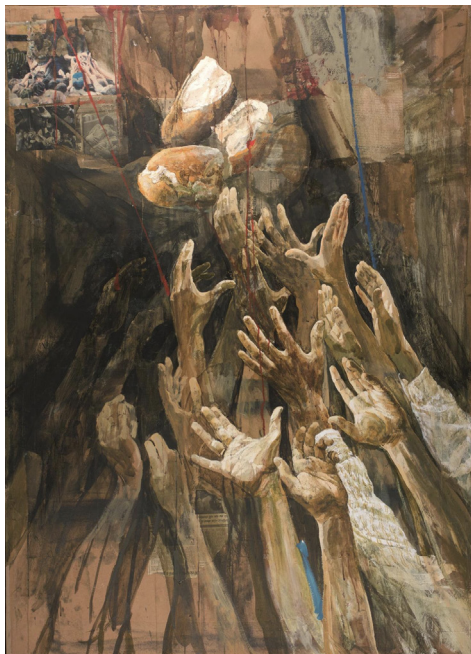
Safet Zec, "Mani per il pane"

Il senso del tempo e della storia ci viene narrato in opere come Mani per il pane. Un'immagine che può appartenere a ogni guerra, a ogni carestia del passato come del presente in cui molte braccia si tendono a cercare sussistenza. Queste braccia emergono da fogli di giornale, da elementi non pittorici, ma in un certo senso storici. Nella grande storia che leggiamo sui libri ci sono le tante piccole storie di ogni braccio teso, come la storia di ognuno di noi. In questa tela non sono solo le pagine di giornale a richiamare la realtà di un fatto, ma anche un ritaglio come applicato alla tela che nella composizione richiama il quadro. Zec sta interpretando il ritaglio amplificandolo attraverso la pittura, rendendolo più presente al nostro vissuto grazie ai tratti che in basso prendono il posto del colore culminando in una macchia accesa di rosso, presagio di sangue. Safet non illustra, ma in silenzio rende invocazioni gli abbracci, le mani tese, le mani abbandonate. Raramente si è feriti da altre opere contemporanee come dalle sue: ferite che permettono all'altro di penetrare fino al nostro cuore e ci rendono capaci di compassione.