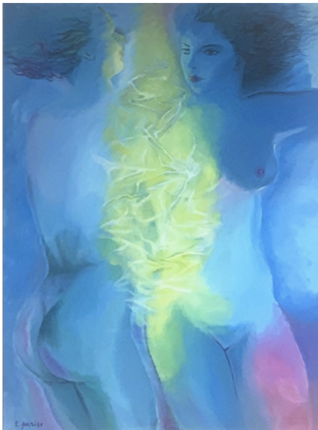
(Tina Parisi - Tratta da Cento opere per una collezione Aspetti dell'Arte del Novecento a Reggio Calabria Laruffa Editore)