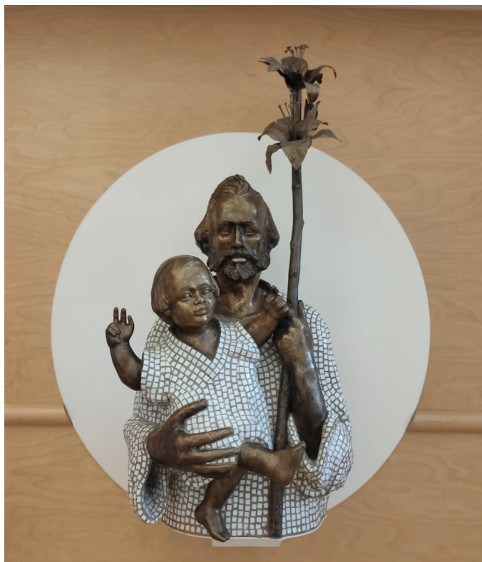
(San Giuseppe e il Bambino, salone Conferenza Episcopale Italiana)