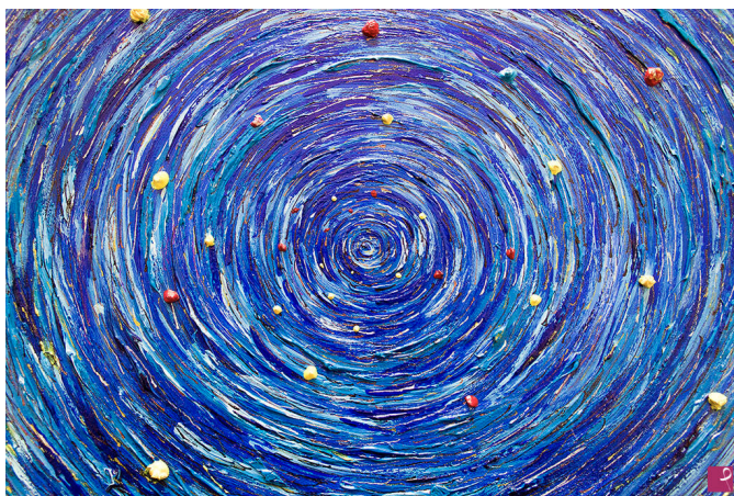
(Opera digigrafica di Claudio Rossetti)

Un buco nero risucchia la nostra fragile esistenza mentre sprofondiamo in una spirale di solitudine e di non senso. Le nostre forze si rivelano incapaci di liberarci da questa stretta di morte che ci avvinghia inesorabilmente. L'angoscia ci opprime. Nella ricerca per uscire da questo vortice di sabbie mobili nelle quali affoghiamo, si fa strada nell'universo e dentro la nostra coscienza una voce che ci chiama e una forza di libertà che